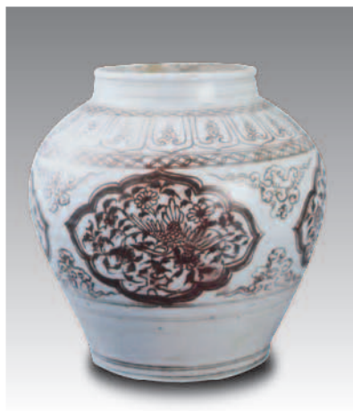
元釉里红开光花鸟纹罐（釉下彩） 高24.8厘米，口径13.3厘米