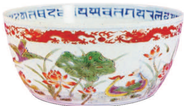
明成化青花斗彩洗 高 8.1 厘米，深 6.7 厘米，口径 16.5 厘米，足径 9.5 厘米

瓷器由中国古代先民首先发明，并长期烧造，后逐渐传遍世界各地。所以中国也被称为“瓷国”，中国的英文名称“China”也有“瓷”的意思。