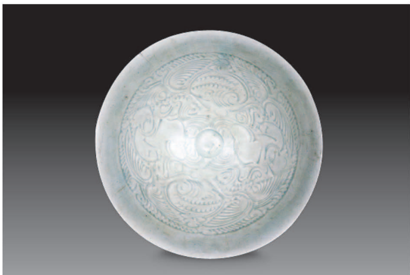
宋影青刻花婴戏莲花纹碗