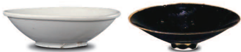
高7厘米，口径8.1厘米，足径3.8厘米

黑釉以铁为主要着色元素，釉中含有5%以上的铁，在高温中焙烧，便呈现黑色，故名。东汉早期越窑已烧制出黑釉，但黑釉不纯。东晋到南朝初的浙江德清窑烧制的黑釉瓷釉面光泽，色黑如漆。唐宋时期由于饮茶的盛行，黑釉茶盏风靡一时，黑釉瓷的制作水平达到新的高度，成为中国传统的瓷器品种之一。