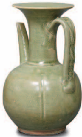
五代越窑系青釉瓜楞执壶 高20.5厘米，口径9.8厘米，底径8厘米