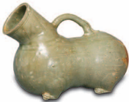
西晋越窑青釉虎子 高18.8厘米，长25厘米

所谓“青釉”，颜色并不是纯粹的青，有月白、天青、粉青、梅子青、豆青、豆绿、翠青等，其中又以粉青、梅子青等品种最为名贵。古代的越窑、婺州窑青瓷釉料中铁的含量在2%~3%，釉色较深，呈豆青色或艾色；唐代瓯窑青瓷釉的氧化铁含量为1.54%，釉作淡青色；德青窑用铁含量很高的紫金土来配制黑釉，使釉内铁含量高达6%~8%，因此釉色黑如漆。