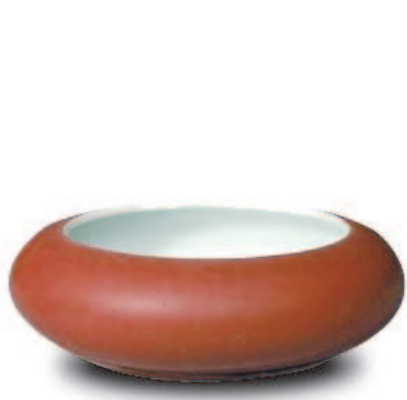
清康熙缸豆红釉洗 高 3.9 厘米，口径 8.2 厘米，足径 7.5 厘米

红釉的出现可以追溯到北宋初年，但真正纯正、稳定的红釉是明初创烧的鲜红。到嘉靖时，又创烧了以铁为呈色剂的矾红。鲜红为高温色釉，矾红为低温色釉。