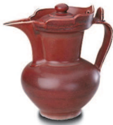
明宣德霁红釉僧帽壶 通高 19.5 厘米，通流长 19.5 厘米，足径 7.5 厘米