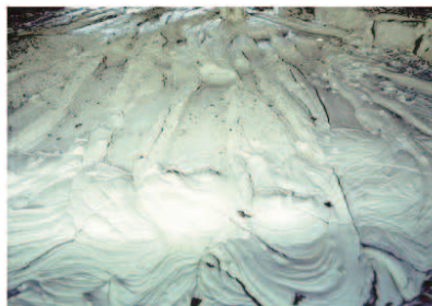
景德镇附近高岭村出产的高岭土矿

二氧化硅 46.51%、氧化铝 39.54%、水 13.95%，熔点为 1780 °C。纯粹的瓷土（矿物学上称“伊力石”）存量不多，而且所谓纯粹的瓷土没有黏土那样强的黏度。一般的瓷土如果放在显微镜下观察，其中银光闪闪、呈非常小的结晶状态的物质就是所谓纯粹的瓷土。通