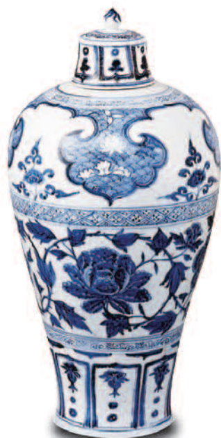
元代苏麻离青料青花梅瓶