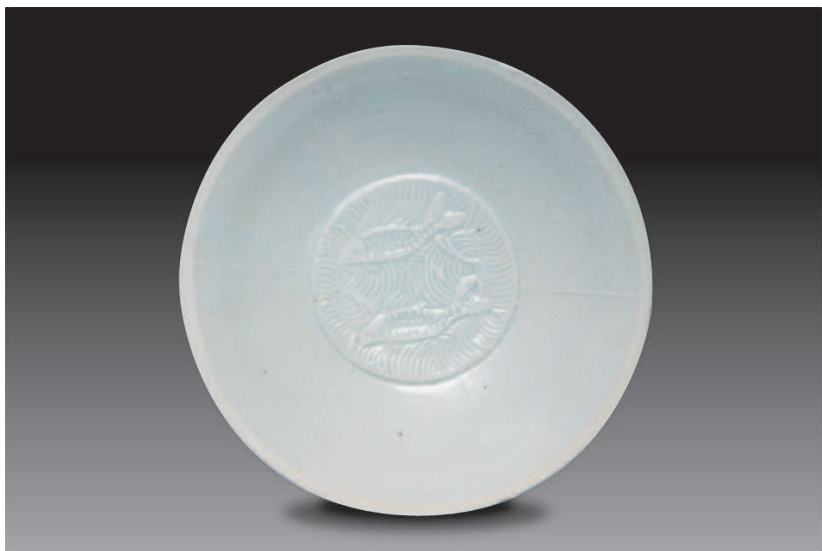
高 3.5 厘米，口径 16.5 厘米，底径 4.3 厘米