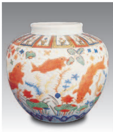
明嘉靖五彩鱼藻纹大罐（釉上彩） 高33.9厘米，口径19.6厘米