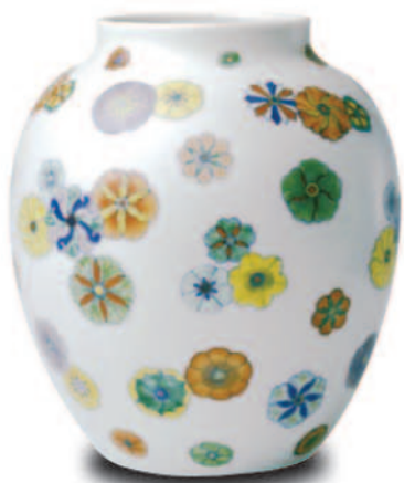
斗彩团花纹罐（釉上彩） 高17.2厘米，口径8.4厘米，足径7.8厘米

一般来说，釉下彩器物的色彩更不容易脱落，也不会析出铅等有害物质，因而更为安全。有些小窑厂使用未经严格提炼的材料甚至化学原料制作釉上彩器皿，长期使用不仅色彩易脱落，还可能对人的健康造成危害。