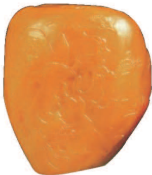
让许多人为之疯狂的田黄

1954年、1956年，人们先后在福州仓山桃花山、仓山乐群路和北郊二凤山出土南朝（420～589）时期用寿山老岭石制作的石猪殉葬品。证明在1 500多年前的南朝，福州地区已形成雕刻寿山石猪作为殉葬品