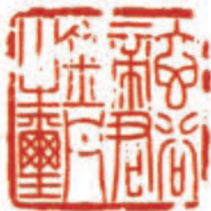
明代的寿山石章及其印文