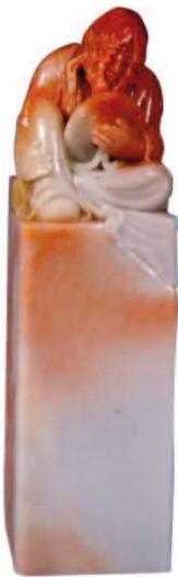
据说是李贽的寿山石章

延入清代，寿山石的采掘十分兴盛，名品的价格也节节上升。毛奇龄的《后观石录》曾记：“康熙戊申（1668），闽县陈公子越山，忽赍粮采石山中，得妙石最伙，载至京师售千金。每石两辄估其等差，而数倍其直，甚有直至十倍者。自康亲王恢闽以来，凡将军督抚，下至游宦兹土者，争相寻觅”。他又说道：“山为之空，近则入山无一石矣。然后收藏家分别其归藏者，以田坑为第一，水坑次之，山坑又次之。每得一田坑，辄转相传玩，顾视珍惜，虽盛势强力不能夺。石益鲜（少），价直益腾（扬），而作伪者纷纷日出，至有假他山之石