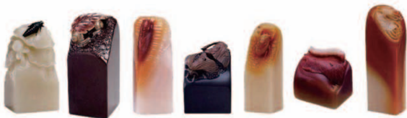
不同色系的寿山石