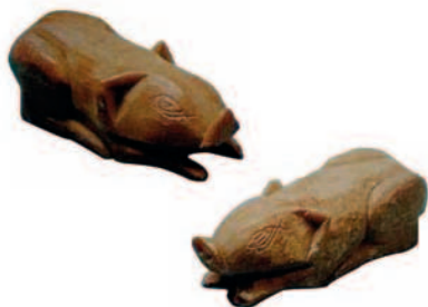
南朝墓葬出土的寿山石猪

的风气，并初具规模。这种利用福州寿山石之名隐喻“福寿”，用于祈求冥福的习俗很可能已影响到全国各地。唐代，寿山广应寺的和尚用寿山石刻成佛珠、佛像、香炉等，送“福”给施主。这是给活人求福的开始。宋代，寿山石更是登上皇宫求福的祭坛。