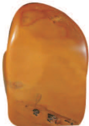
寿山石中的瑕疵——蛙洞

另外还有其他的一些瑕疵，如膏状物、蛙洞、锈空、黑针等。膏状物，即石质不纯，或各色膏状物混杂其中。蛙洞，即石块表面破碎过大或破成各种大小不一的空洞。锈空，即石表有小细洞，肌理内部有小破洞而在石表留下摸不到的锈斑点。黑针，即石质肌理黑点白点散布，石农形象地称之为“蚤卵”。