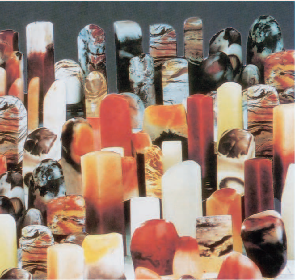
五彩斑斓的寿山石

代（距今约 2.3 亿年至 6700 万年），在今日福建的东部发生了一次地质大变动，大量岩浆冲出地表，形成火山岩。在火山喷发的间隙或喷发结束之后，伴随着的大量的酸性气、热液活动，交替分解了周围岩层中的长石类矿物，将其原先含有的比较活跃的钾、钙、镁和铁等元素分化，而保留下较为稳定的铝、硅等元素。这些含铝、硅元素的溶液沿着周围岩石的裂隙沉淀晶化而成矿，便成为叶蜡石、高岭石、地